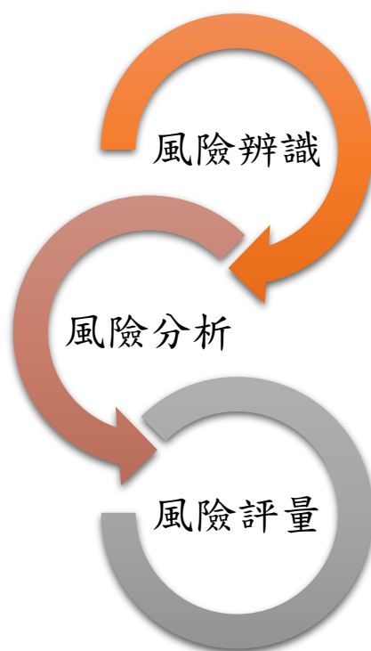
圖 4 風險評估步驟