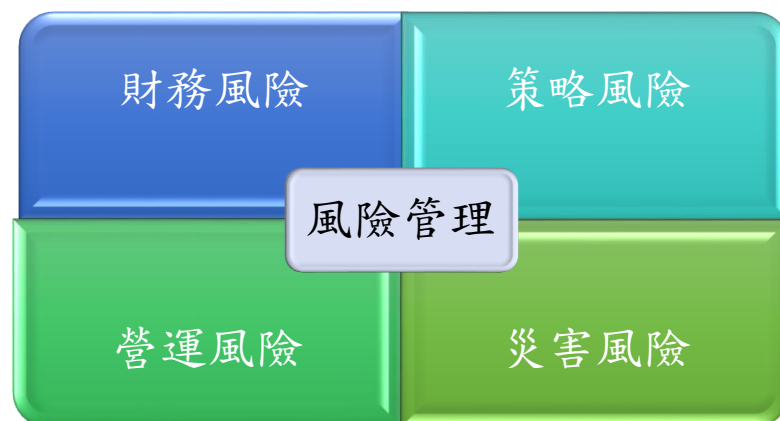
圖 3 風險管理範疇