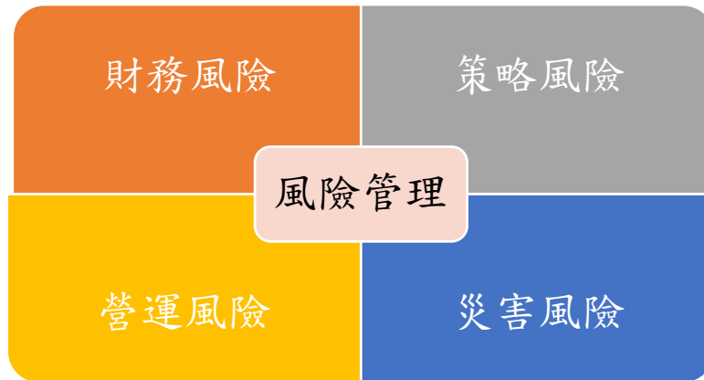
圖 3 風險管理範疇