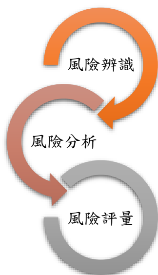
圖 4 風險評估步驟