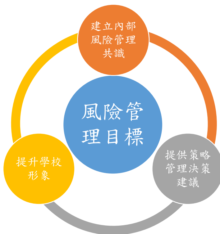
圖 2 風險管理目標

本校將風險管理目標設定為：建立內部風險管理共識、提供策略管理決策建議及提升學校形象。