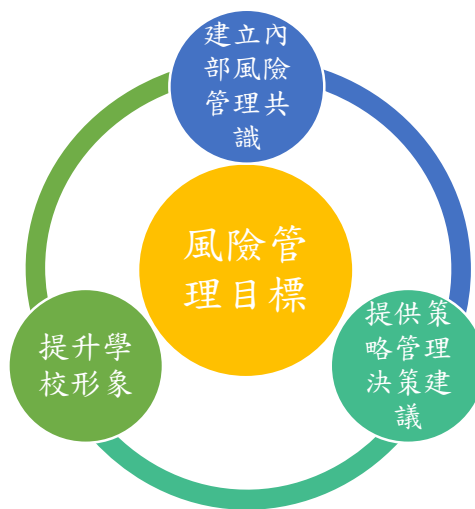
圖 2 風險管理目標

本校將風險管理目標設定為：建立內部風險管理共識、提供策略管理決策建議及提升學校形象。