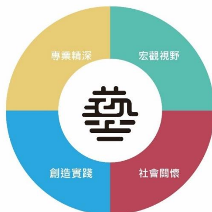
圖一 本校教育目標