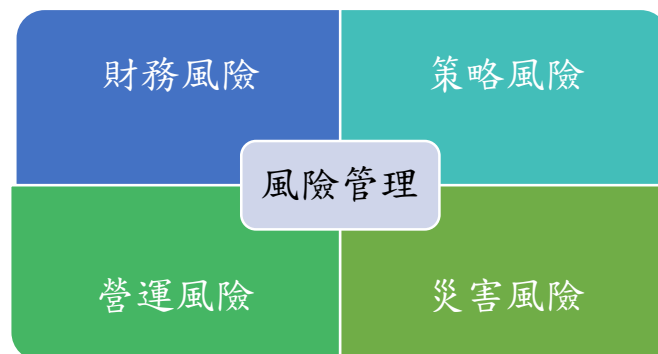
圖 3 風險管理範疇